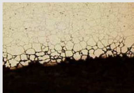
สนิมที่เกิดขึ้นกับผิวของหลังคาเหล็ก

นอกจากนี้ อะลูมิเนียมซีท K-Roof ยังผ่านการรับรองจากมหาวิทยาลัยเทคโนโลยีพระจอมเกล้าพระนครเหนือในการทดสอบคุณสมบัติเรื่องการสะท้อนพลังงานรังสีอาทิตย์ (Solar Reflectance) ที่ทดสอบด้วยเครื่อง Shimadzu UV-3100 (UV-VIS-NIR Recording Spectrophotometer) โดยค่าการทดสอบที่ได้จะถูกนำมาคำนวณหาค่าการสะท้อนพลังงานรังสีอาทิตย์ตามมาตรฐาน ASTM E903_82 และทดสอบวัดค่าการคายความร้อนด้วยเครื่อง Emissometer ของบริษัท Devices & Services รุ่น AE. จากผลการทดสอบพบว่าอะลูมิเนียมซีท K-Roof จะดูดกลืนความร้อนได้น้อยกว่าวัสดุหลังคาทั่วไป ทำให้อุณหภูมิใต้แผ่นหลังคาอะลูมิเนียมเย็นกว่าวัสดุหลังคาทั่วไปถึง 3-12 องศา